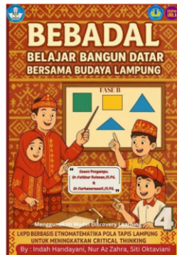
Gambar 2. Cover LKPD

Pada analisis uji normalitas, nilai NGAIN yang diperoleh adalah 0,80, yang berada di atas nilai ambang batas 0,7, yang mana menunjukkan kategori tinggi. Dalam hal ini, kriteria tinggi berarti bahwa data yang diperoleh memiliki distribusi yang hampir normal. Artinya, data yang dianalisis tidak mengalami penyimpangan yang berarti dari distribusi normal. Uji normalitas ini bertujuan untuk memastikan bahwa data yang digunakan dalam penelitian ini memenuhi asumsi dasar dari banyak uji statistik parametris, termasuk uji t-test, yang memerlukan data yang terdistribusi normal. Oleh karena itu, dengan nilai NGAIN yang tinggi ini, kita dapat mengatakan bahwa data yang digunakan dalam analisis ini memenuhi asumsi normalitas dan dapat dilanjutkan ke uji statistik lainnya.