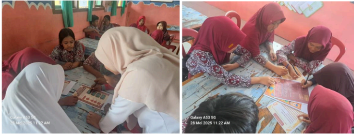
Gambar 1. Proses Implementasi LKPD