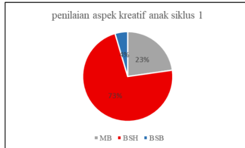
Gambar 2. Diagram hasil siklus 1

Diagram tersebut mengindikasikan adanya peningkatan anak yang berkembang sesuai harapan (BSH) menjadi 73%. Ditambah lagi, terdapat 4% atau 1 orang anak yang berkembang sangat baik (BSB). Perkembangan ini telah melampaui standart yang diinginkan sehingga kreativitas anak KB Srikandi meningkat dari 59% menuju 77%. Setelah siklus 1 ini hanya tersisa 5 anak yang belum berkembang sesuai harapan. Oleh sebab itu, evaluasi perlu dilakukan agar hasilnya dapat ditingkatkan lagi ke depannya.