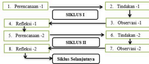
Gambar 1. Alur Penelitian Tindakan Kelas (Arikunto, 2021)

Model penelitian tindakan kelas yang digunakan oleh peneliti adalah model yang dikembangkan oleh Arikunto (2021) pada Gambar 1 berikut ini: